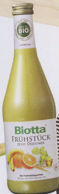
Biotta Suc Mic Dejun. www.biosens.ro . Preț: 13,77 lei.