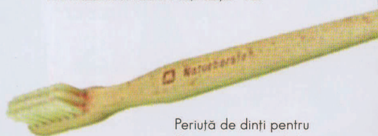
Periuță de dinți pentru copii, confecționată manual din lemn și cu păr sterilizat de porc, fără nailon. www.organicbaby.ro . Preț: 35 lei.