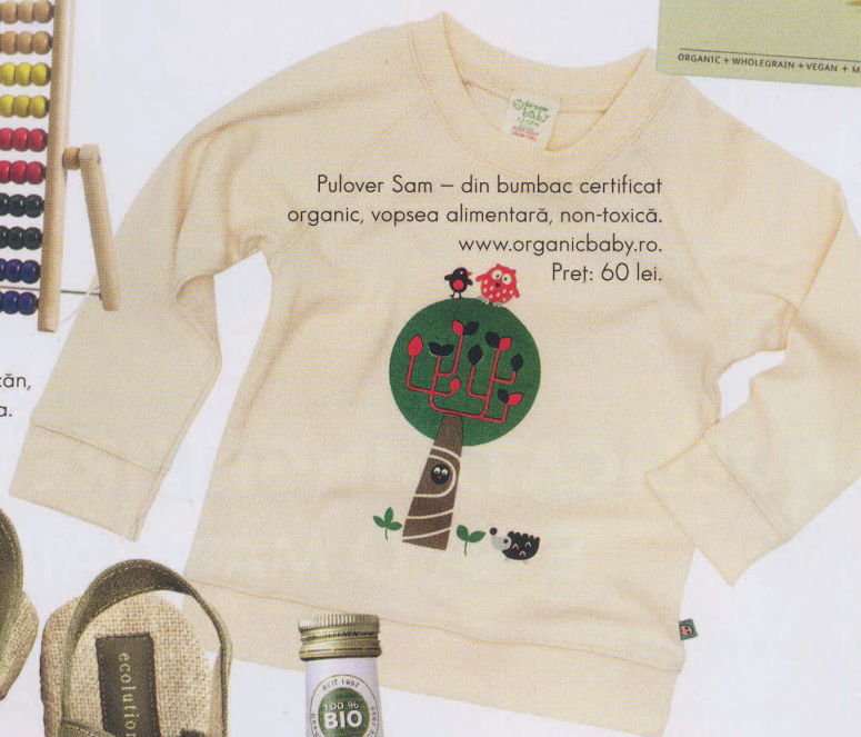
Pulover Sam – din bumbac certificat organic, vopsea alimentară, non-toxică. www.organicbaby.ro . Preț: 60 lei.