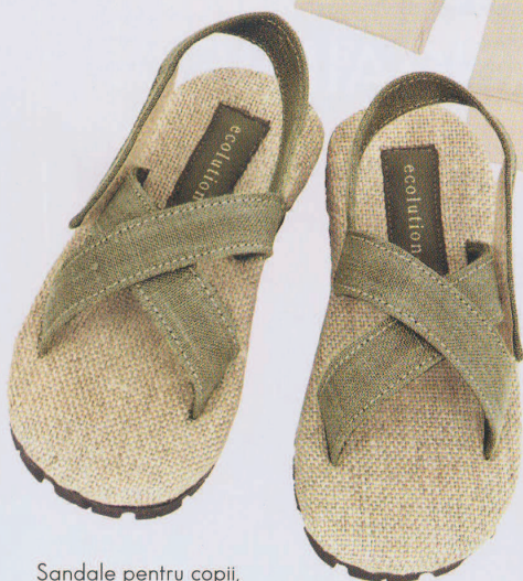
Sandale pentru copii, ajustabile, din materiale organice. www.ecolution.com . Preț: 58,07 lei.