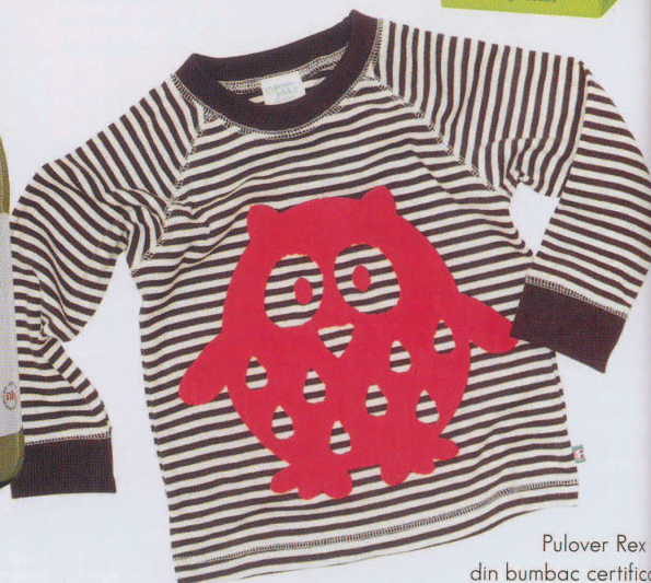
Pulover Rex – din bumbac certificat organic, vopsea alimentară, non-toxică. www.organicbaby.ro . Preț: 60 lei.