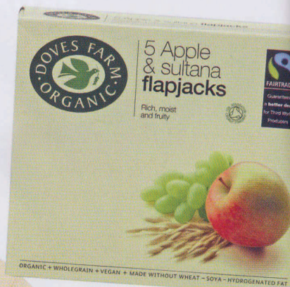
Doves Farm Organic, 5 batoane de ovăz cu măr și stafide. Pukka Food. Preț: 19 lei.