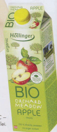
Suc de mere de livadă bio NFC – Höllinger. www.biosens.ro . Preț: 11 lei.